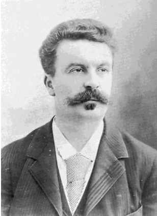
Εικόνα 2: Guy de Maupassant 1850-1893

Η καταληκτική αιχμή του διηγήματος σημειώνεται στο τέλος, όταν ο αμαξάς μοιράζεται τον πόνο του με το άλογο και προκαλεί τον αναγνώστη να ξαναδιαβάσει το κείμενο με κριτική ματιά, καθώς γνωρίζει πλέον τη μοναξιά του αμαξά και την έλλειψη επικοινωνίας με τους ανθρώπους.