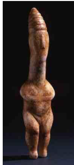
Εικόνα 3: © Ίδρυμα Ν.Π. Γουλανδρή - Μουσείο Κυκλαδικής Τέχνης. Συλλογή Ν.Π. Γουλανδρή, αρ. 1111

Τα ειδώλια "τύπου Πλαστηρά", που οφείλουν την ονομασία τους στο ομώνυμο νεκροταφείο της Πάρου, εμφανίζονται παράλληλα με τα βιολόσχημα και αντιπροσωπεύουν την πρωιμότερη προσπάθεια φυσιοκρατικής απόδοσης της ανθρώπινης μορφής κατά την 3η χιλιετία π.Χ. [...] Οι γλύπτες, πάντως, δεν έχουν κατακτήσει ακόμη την αφαιρετικότητα της ώριμης περιόδου της κυκλαδικής τέχνης και διατηρούν μια έντονη φυσιοκρατική αντίληψη, που είναι ιδιαίτερα εμφανής στην περιοχή της λεκάνης, του ηβικού τριγώνου και των σκελών.