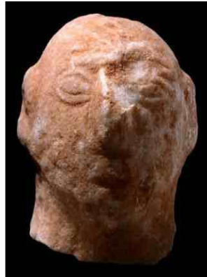
Εικόνα 5: © Ίδρυμα Ν.Π. Γουλανδρή - Μουσείο Κυκλαδικής Τέχνης. Συλλογή Ν.Π. Γουλανδρή, αρ. 259

Κεφαλή ειδωλίου μάρμαρο Κυκλαδικό Πρωτοκυκλαδική III περίοδος 2300-2000 π.Χ. Ύ.: 9,7 εκ. / Πλ.: 7,6 εκ. Από τη Σχινούσα (:)