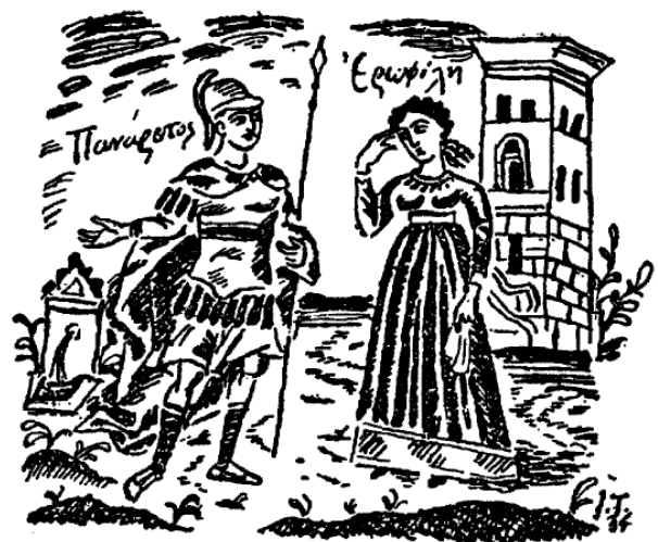
Εικόνα 1: Σκηνή από την Ερωφίλη , έργο του Γιάννη Τσαρούχη, 1934

Προβάλλεται μια κοινωνία, οι άνθρωποι της οποίας αισθάνονται έρμαιο στη βούληση και τη δεσποτεία του εκάστοτε βασιλιά, ενώ έχουν αναπτυγμένο το αίσθημα της εκδίκησης σε περίπτωση που χρειασθεί να απονεμηθεί δικαιοσύνη. Επιπλέον αντανάκλαται και η αντίληψη πως όλοι οι άνθρωποι είναι ισότιμοι με τους βασιλείς απέναντι στο Θεό και τη μοίρα, όπως προκύπτει από τα λόγια του Χορού στο τέλος της τραγωδίας που δηλώνει ότι τα πλούτη και οι καλομοιρίες είναι απλά μια ασκιά (Ε, 671-2).