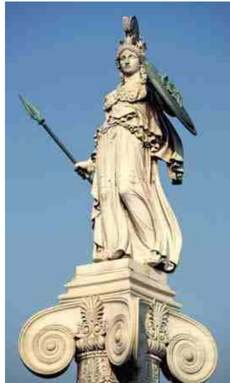
Εικόνα 2: Λ. Δρόσος, Η Αθηνά, Ακαδημία Αθηνών (Δεκαετία 1870)