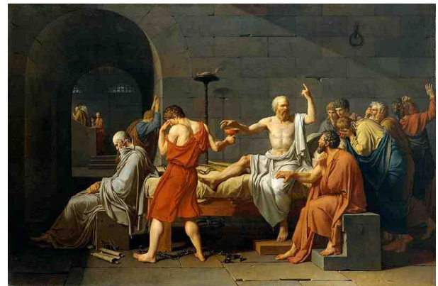
Εικόνα 3: J-L. David, Ο θάνατος του Σωκράτη (1787)

Οι Γάλλοι στην Επανάσταση του 1789 θεωρούσαν ότι ήταν αναγεννημένοι Έλληνες ή Ρωμαίοι. Στα έργα τέχνης τους αντανακλάται το ρωμαϊκό μεγαλείο, ενώ ο κυριότερος εκπρόσωπος του νεοκλασικού ύφους ήταν ο Jacques-Louis David, 34 ο οποίος μαθήτευσε κοντά στον πρόεδρο της Royal Academy του Λονδίνου Joshua Reynolds. Ο Reynolds παρότρυνε τους σπουδαστές του να προτιμούν θέματα για τα έργα τους από την ελληνορωμαϊκή αρχαιότητα. 35 Χαρακτηριστικό έργο του Νταβίντ στο οποίο καταφαίνονται τα φιλελληνικά του συναισθήματα και προηγήθηκε της Γαλλικής Επανάστασης αποτελεί ο πίνακας του Θανάτου του Σωκράτη (1787, εικ. 3). Το ίδιο το εικονιζόμενο θέμα προδίδει το φιλελληνισμό του καλλιτέχνη. Ο Σωκράτης δεσπόζει στο κέντρο της εικόνας και φαίνεται πως ακόμη και λίγο πριν το θάνατό του διδάσκει στους ανθρώπους που τον περιτριγυρίζουν. Φαίνεται, μάλιστα ότι τους παρηγορεί ώστε να μην λυπούνται για το θάνατό του καθώς είναι έτοιμος να πει το δηλητήριο τη στιγμή που ο περίγυρός του δεν αντέχει τη θέα της επιβαλλόμενης αυτοκτονίας.