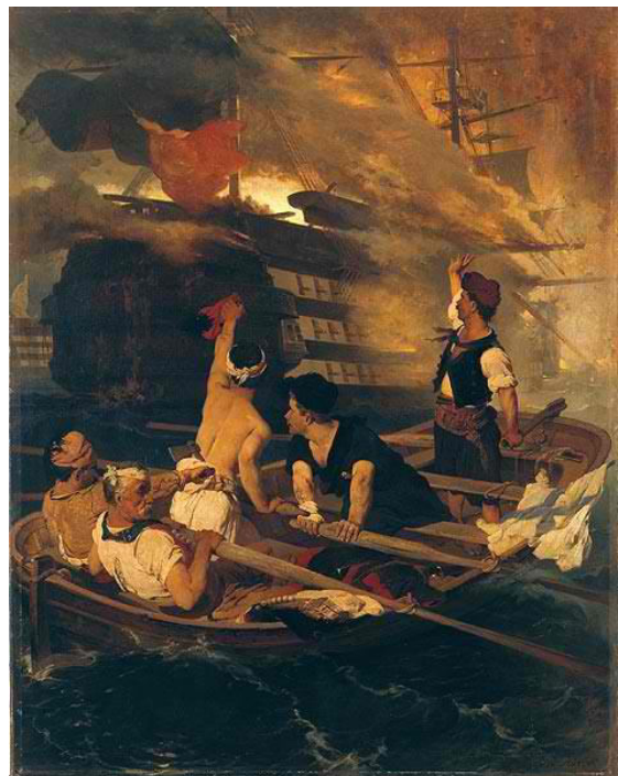
Εικόνα 1: Ν. Λύτρας, Η Πυρπόληση της τουρκικής ναυαρχίδας από τον Κανάρη (1872)

Οι εικαστικές τέχνες στράφηκαν στο Νεοκλασικισμό, στο πλαίσιο του οποίου Γερμανοί καλλιτέχνες ανέλαβαν την αναμόρφωση της πρωτεύουσας του νεοσύστατου ελληνικού έθνους. Η ζωγραφική υιοθέτησε τον Ακαδημαϊκό Ρεαλισμό, διαδραματίζοντας κύριο ρόλο η Ακαδημία του Μονάχου, η επίδραση της οποίας ήταν καταλυτική στην ελληνική τέχνη. 16 Η γλυπτική απηχούσε την αντίληψη της εποχής, η οποία συνέδεε την καταβολή του νεοσύστατου ελληνικού κράτους με την αρχαία Ελλάδα. 17 Τα έργα με ιστορικό περιεχόμενο λειτούργησαν ως ηθοπλαστικοί καταλύτες, συμβάλλοντας στη συνδιαμόρφωση της εθνικής ταυτότητας, παράλληλα με την Ιστορία του Ελληνικού Έθνους του Κ. Παπαρρηγόπουλου και τις μελέτες του Ν. Πολίτη για το λαϊκό πολιτισμό. 18